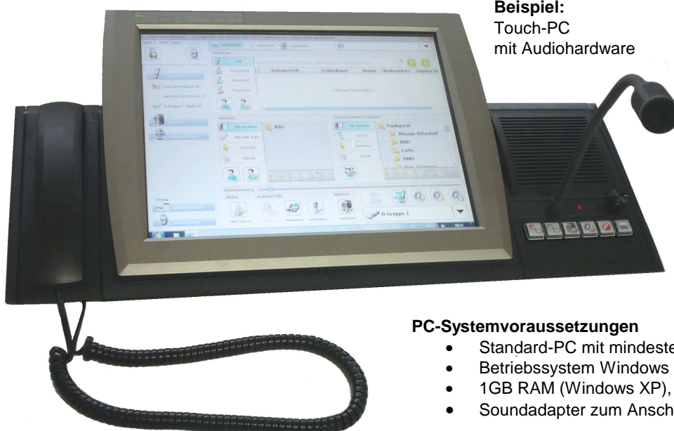
Beispiel: Touch-PC mit Audiohardware